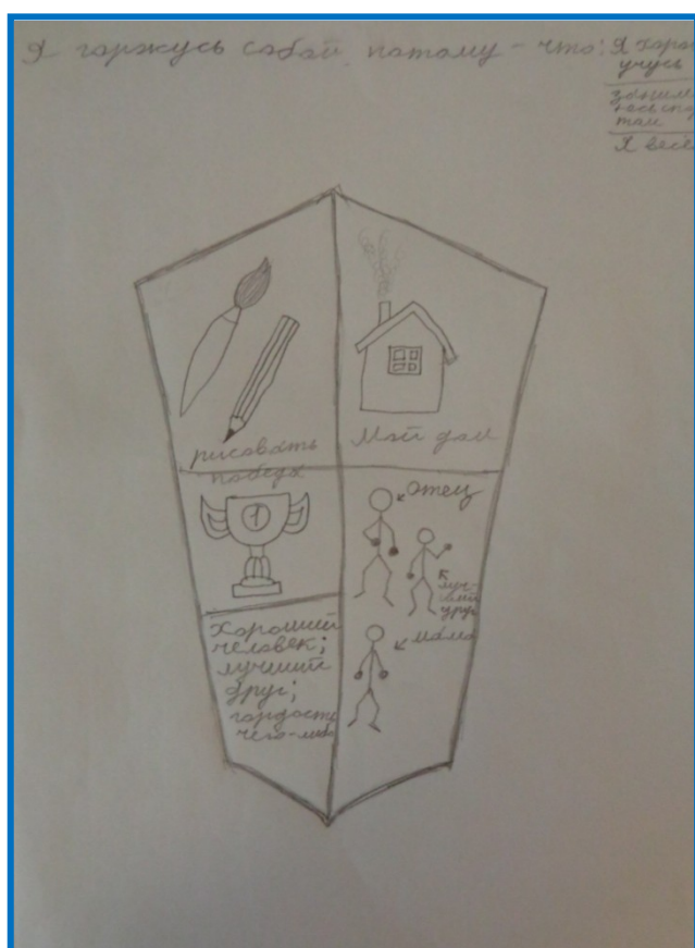
Игорь, 1 отряд